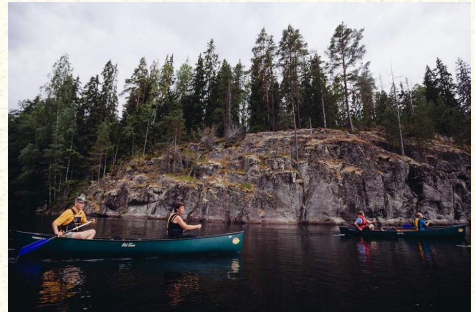
Turneu me kajak me guidë në Parkun Nacional në Nuksio, si rajon Natura 2000 (Finlandë)

Aktivitetet e këtilla rekreative janë në përputhje me dispozitat e Direktivave për vendbanime dhe shpendë, nëse të njëjtët nuk ndikojnë negativisht mbi vendbanimet dhe llojet e pranishme. Çelësi më shpesh fshihet në planifikimin dhe shfrytëzimin racional të resurseve, në mënyrë që nuk do të rrënohen vlerat që shërbejnë si bazë për ekzistimin e tyre.