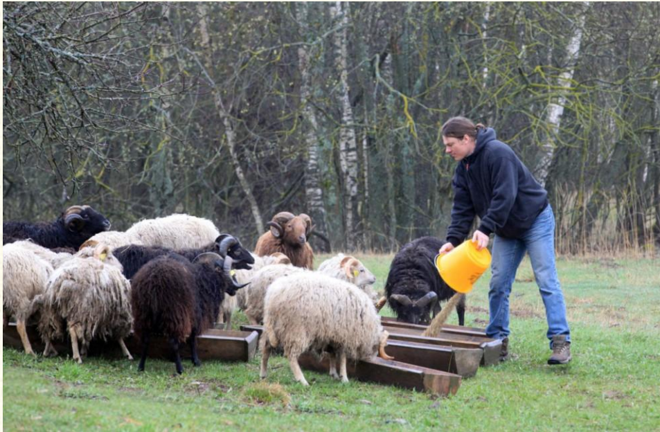
Kullotja e dhenëve me pronar privat që të ruhen shpatet e hapura të Parkut Nacional Aukshtatia, si rajon i Natura 2000 (Lituan)

Gjegjësisht, në shumë rajone, vendbanimet dhe llojet që janë të pranishme atje kryesisht janë të varura nga vazhdimësia e aktiviteteve të tilla për mbijetesën e tyre afatgjate, andaj në raste të tilla, me rëndësi është të gjenden mënyra të mbështeten dhe, sipas nevojës, të përfordohen aktivitetet e tilla siç janë për shembull kullotjet ose krasitjet e rregullta të kaçubeve.