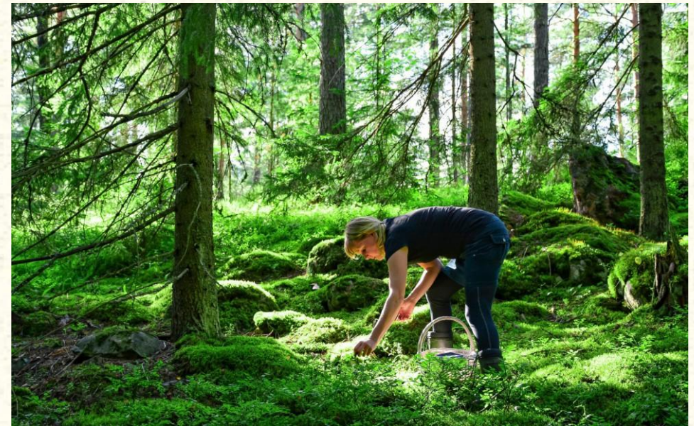
Begatitë e pyjeve

Jo, pyjet në Natura 2000 mund të menaxhohen për qëllime dhe funksione të ndryshme, gjegjësisht, përveç qëllimeve për mbrojtje të natyrës, ata mund të menaxhohen edhe për shkak të prodhimit të drurit, gjuetisë, rekreacionit, etj. Por, menaxhimi me pyjet në rajonet e Natura 2000 patjetër gjithmonë të jetë në përputhje me qëllimet specifike të mbrojtjes së natyrës dhe në mënyrë aktive të kontriboj në këtë drejtim. Atje ku rajoni në Natura 2000 gërshetohet me ndonjë rezervat natyror ose park nacional, pyjet më shpesh menaxhohen për qëllime mbrojtëse, sipas ligjit aktual nacional. Menaxhimi efektiv me rajonet e Natura 2000 nënkupton bashkëpunim të ngushtë mes institucioneve relevante për mbrojtjen e natyrës dhe për pylltari, këshilltarëve privat dhe publik për pyje, palëve tjera të përfshira dhe organizatave joqeveritare. Prandaj, shumë është me rëndësi që të njëjtët të arrijnë marrëveshje mes tyre, marrëveshje e cila do të jetë e volitshme dhe do të ec në drejtim të plotësisht të të drejtave dhe interesave ligjore të palëve të përfshira.