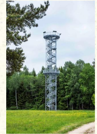
Observatori në qarkun Kamanai, rezervat i rreptë natyror me pamje peizazhi të moçaleve dhe ishujve Kamanos, të rrethuar me pyje (Lituani)