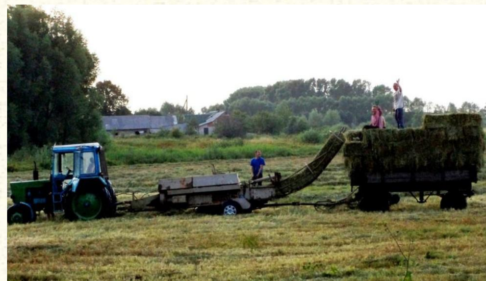
Kositje në rajonin e Natura 2000, sipas Planit për menaxhim në rajonin e mbrojtur (Lituani)