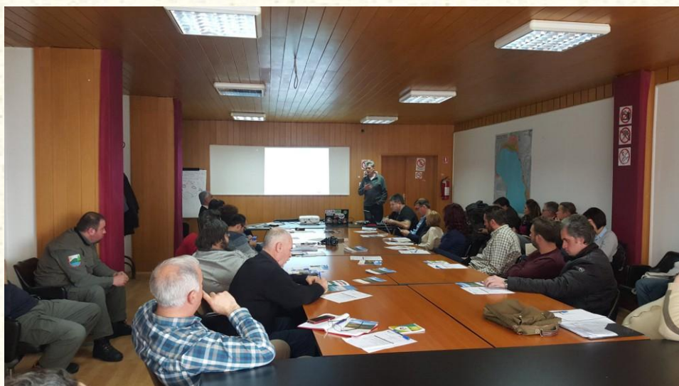
Dikustim për Planin për menaxhimin e rajonit potencial të Natura 2000 në Liqenin e Prespës (Maqedonia e Veriut)

Planet për menaxhim janë vegël e dobishme me çka planifikohen aktivitetet që realizohen në rajon, me qëllim që i njëjti të ruhet në statusin e volitshëm të konzervimit sa u përket vendbanimeve dhe llojeve të rëndësishme për BE. Këto plane bëhen në përkim me nevojat e çdo rajoni të veçantë dhe japin mundësi për konsultime me palët e përfshira (organet e menaxhimit me rajonin e mbrojtur, vetëqeverisja lokale, organizatat joqeveritare, bashkësia lokale, etj.)