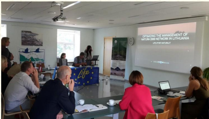
Projekt i integruar LIFE në Lituani "Optimizimi i menaxhimit me rrejtin e Natura 2000 në Lituani"

Programi Lajf -LIFE është programë e vetme, evropiane që synon financimin e projekteve në fushën e mjedisit jetësor dhe mbrojtjen e natyrës në vendet e BE (por edhe në vendet kandidate për BE, vendet në proceset drejtë anëtarimit në BE dhe në vendet fiqnje). Projektet e realizuara nën ombrellën e kësaj programe i arrijnë rezultatet e pritura nga mjetet e investuara, sigurojnë dhe hapin vende pune, ndihmojnë me projekte inovative nëpër BE, dhe përfundojnë me rezultatet të kënaqshme, konkrete.